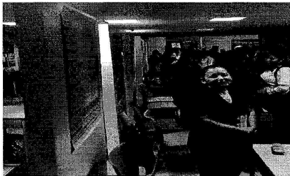
Exposición de proyectos 25 de Septiembre 2018 Instalaciones Comfenalco Santander

Organización del I encuentro de proyectos ABP de la Fundación Universitaria Comfenalco Santander, Bucaramanga 25 de septiembre 2018